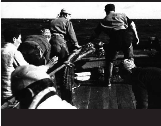
Vittorio De Seta, Lu Tempu di li pisci spata , 1954.