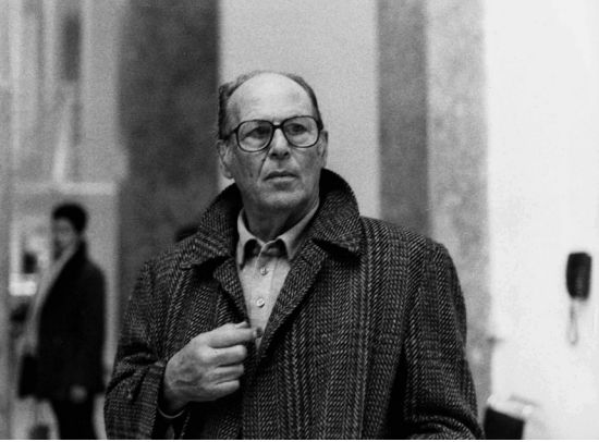
Vittorio De Seta.