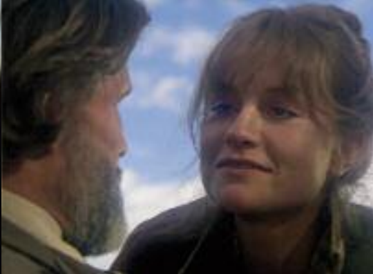
TWENTYNINE PALMS LA PORTE DU PARADIS