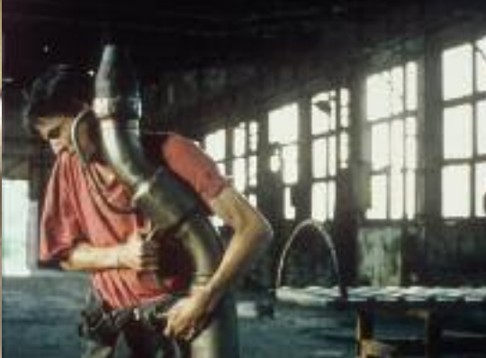
ENTRE NOS MAINS CE VIEUX RÊVE OUI BOUGE