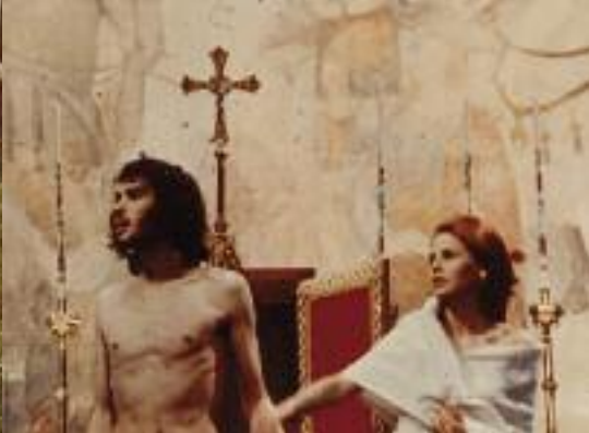
LE SACRIFICE LES CANNIBALES