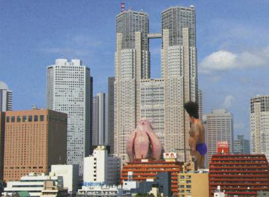
BIG MAN JAPAN