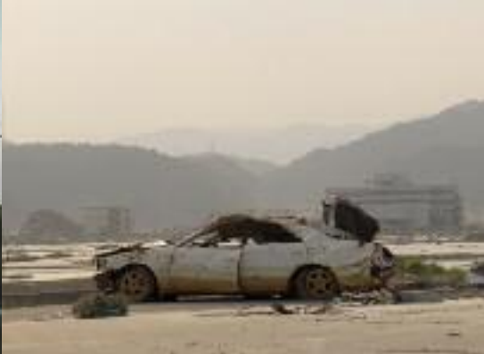
4 BÂTIMENTS, FACE À LA MER FOUR MONTHS AFTER