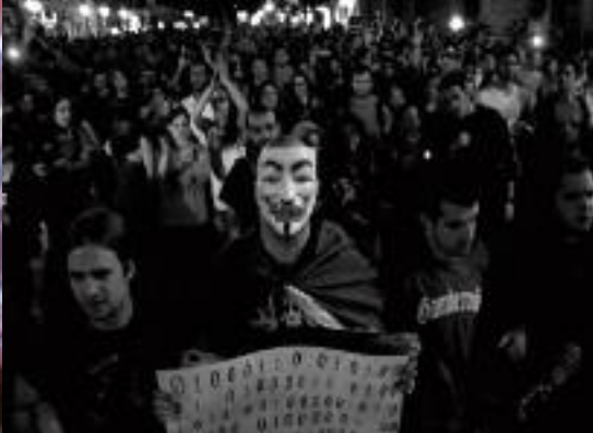
GRAVITY HILLS NEWSREELS VERS MADRID !