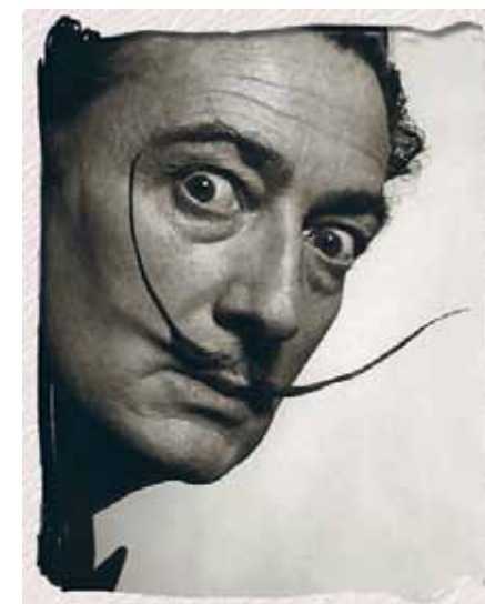
Droits d'Image de Salvador Dalí réservés. Fundació Gala-Salvador Dalí, Figueras, 2012.

L'un vit à Banyols, non loin de Figueras, l'autre près de Zurich. Les deux hommes sont amis. Albert Serra et Hans Ulrich Obrist se sont depuis quelques années lancés le défi « de parler de Dalí toute la nuit ».