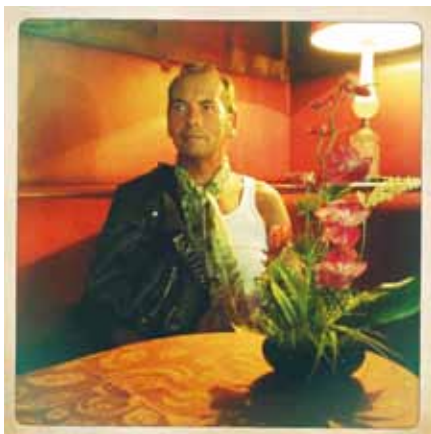
Les Trois Petits Cochons, 2012

Johann Wolfgang von Goethe (à partir des Conversations de Goethe avec Eckermann , ce dernier ayant assisté l'écrivain dans les dernières années de sa vie), Adolf Hitler (à partir de Hitler's Table Talk 1941-1944. His Private Conversations , édité en France en 1952 sous le titre Libres propos sur la guerre et la paix, recueillis sur l'ordre de Martin Bormann , et aujourd'hui interdit, une série de monologues et conversations entre Hitler et son cercle le plus proche, ayant eu lieu dans le quartier général du Führer, entre 1941 et 1944) et Rainer Werner Fassbinder (à partir d'une série d'entretiens avec le cinéaste allemand, Fassbinder über Fassbinder : Die ungekürzten Interviews , non traduits en France à ce jour). La mise en scène d'Albert Serra reste, tout au long de l'œuvre, assez littéralement attachée aux textes. La construction sous forme de journal, l'ordre chronologique et les dialogues y sont respectés. Les comédiens, pour la plupart non professionnels, répètent ici chacun un texte qui leur est lu, hors cadre, au moyen d'une oreillette. Fruit de 100 jours de tournage ininterrompu, en public, dans les décors de Kassel, le film n'a été présenté à ce jour dans son intégralité que lors des derniers jours de la dOCUMENTA, en septembre, 9 jours durant, 24 heures sur 24, dans une salle de cinéma de la ville, le Gloria Cinema.