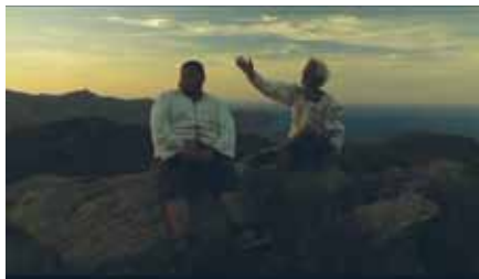
Sant Pere de Rodes, 2006

Samedi 4 mai, 20h, Cinéma 2, séance présentée par Albert Serra