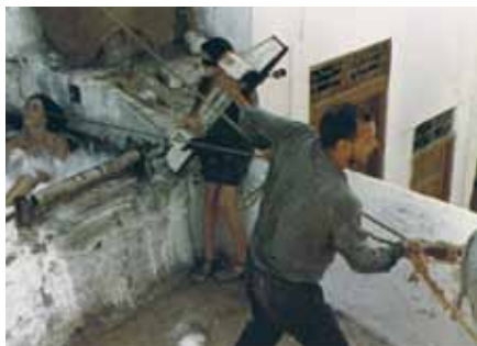
Viva la muerte, 1971