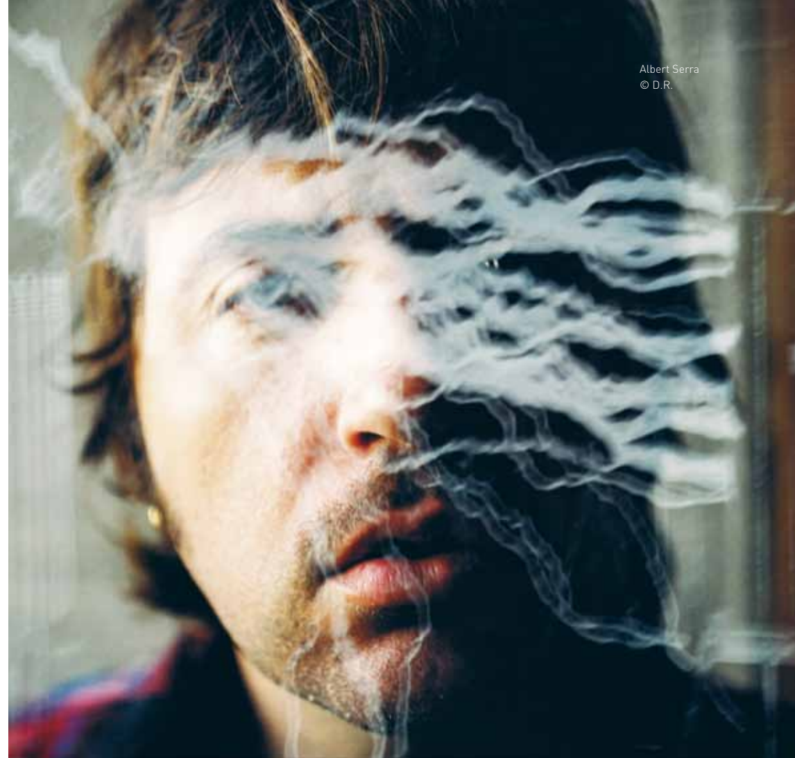
Albert Serra © D.R.

Tout compte fait, le problème est simple : des personnages comme Hitler, Dalí ou Warhol sont à la fois eux-mêmes et leur propre caricature. Ils ont fait le travail pour nous avant que quelqu'un ne s'attelle à la tâche et quand ils se sont présentés au monde, au grand public, ils l'ont fait avec leur lecture incorporée en eux, la plus impitoyable possible. C'était, en effet, celle qui pouvait les blesser le plus, la plus caricaturale. Dans chacune de leurs apparitions, chaque image publique (en fait, ils n'ont rien de privé afin d'éviter que quelqu'un les regarde secrètement, c'est pourquoi ils s'exposent en permanence, ce qui équivaut, en fait,