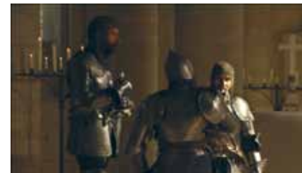
L'Alto Arrigo, 2008 © Andergraun Films