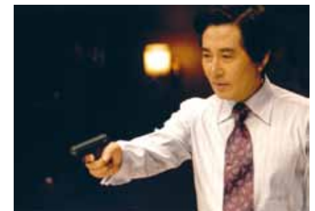
The President's Last Bang, 2005

Dimanche 28 avril, 17h30, Cinéma 2, Séance présentée par Albert Serra et un invité