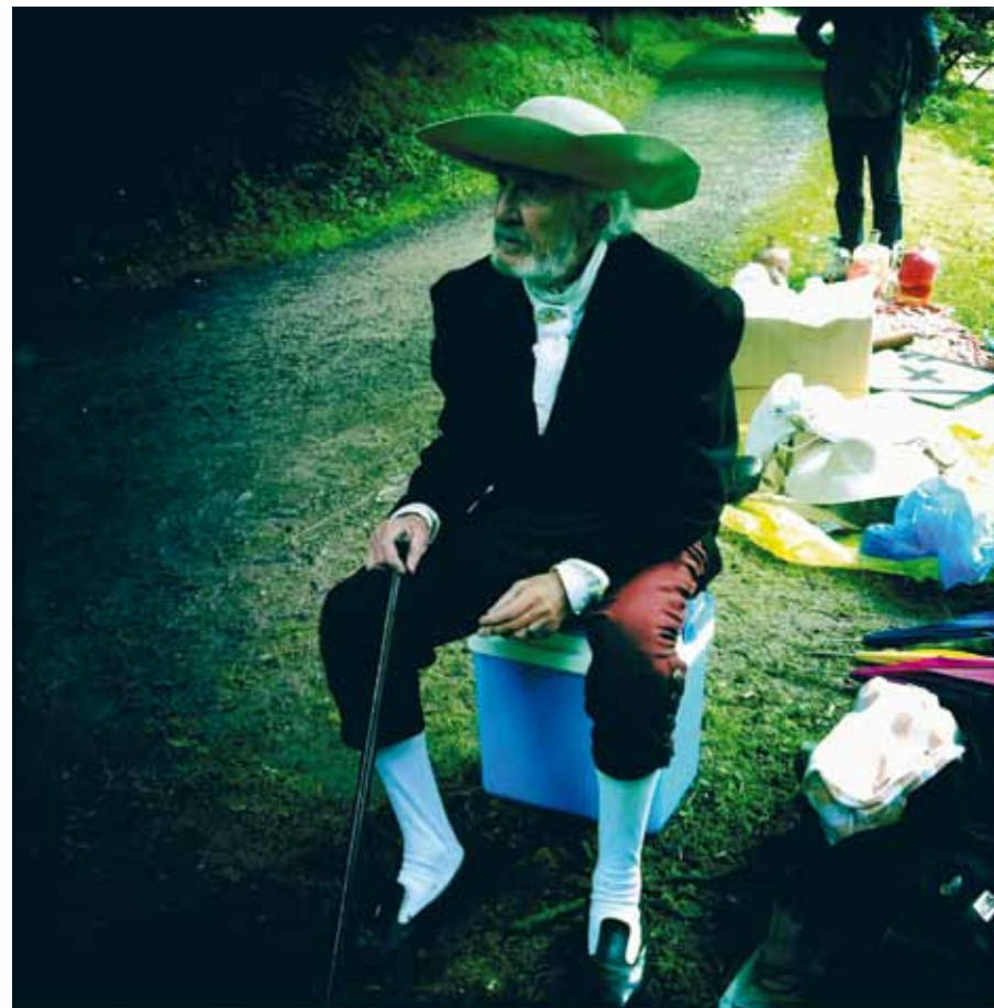
Les Trois Petits Cochons , 2012 © Montse Triola

sa continuité : mis bout à bout, il dure un peu plus de 101 heures. Soit l'équivalent moyen de cinquante longs métrages. Comment atteint-on une telle extrémité de cinéma ? De quelle matière, de quelle vie, remplit-on une telle durée ? Comment, de notre côté, recevoir un tel film ? La seule question qu'il serait inutile de se poser est de savoir si c'est du cinéma ou de l'art contemporain – autant se demander si c'est de l'art ou du cochon,