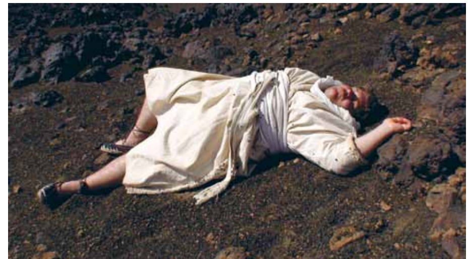
Waiting for Sancho , 2008

Présenté chaque jour, en boucle, au Forum -1, Accès libre