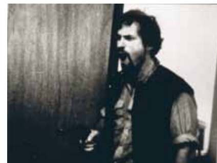
Beyond the Law, 1968