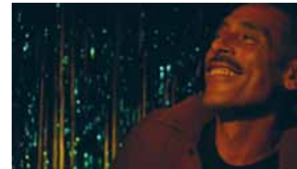
Cuba Llibre, 2013