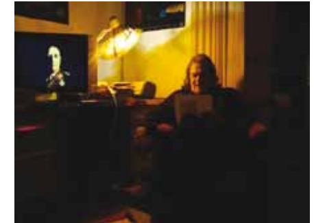
Lectura d'un poema, 2010