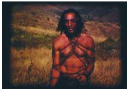
Super 8, 2006