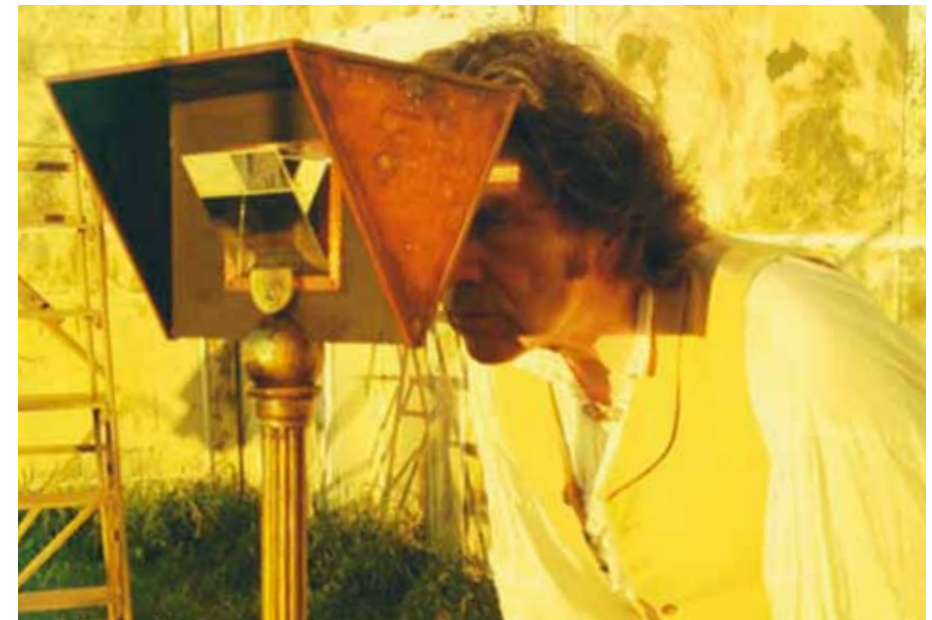
Les Trois Petits Cochons , 2012 © Román Bayarri

Samedi 4 mai, 17h30, Petite salle, entrée libre