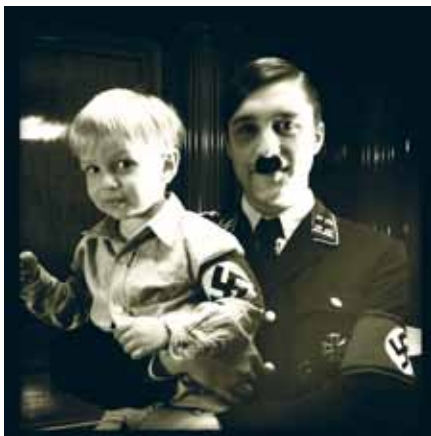
Les Trois Petits Cochons , 2012 © Jordi Mitjà

les observations de penseurs et de guides allemands sur la beauté, la vie, l'art, l'avenir, le passé, la nature, la technique, la politique ou sur tout ce qui est digne de discours – certaines parties étant même reprises plusieurs fois dans différentes bouches. Au fil des jours, l'argument louvoie, se noue et se dénoue. Le monde ne cesse de rayonner ; chaque image a du charme et de la force, chaque figurant(e) est considéré(e) avec amour, dans toutes ses hésitations, dans sa fragilité – comme représentant, comme médium. Ça et là, il arrive que se rencontrent ces figures allemandes – ça devient alors tout à fait surréaliste, l'air paraît se figer. Certes, ils ne peuvent pas vraiment parler l'un avec l'autre mais l'un vers l'autre, oui. Et, naturellement, tout ce qui a été énoncé ici en tant que règles ou observations admet des exceptions. Une seule chose est certaine : Les Trois Petits Cochons est une aventure absolument effarante, enrichissante et revigorante.