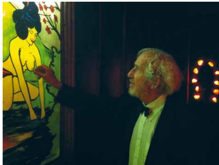
Les Trois Petits Cochons , 2012 © Jordi Mitjà

Le film est projeté sur grand écran, au Forum -1, par séquences de 10 heures, tous les jours, à partir de 11h30.