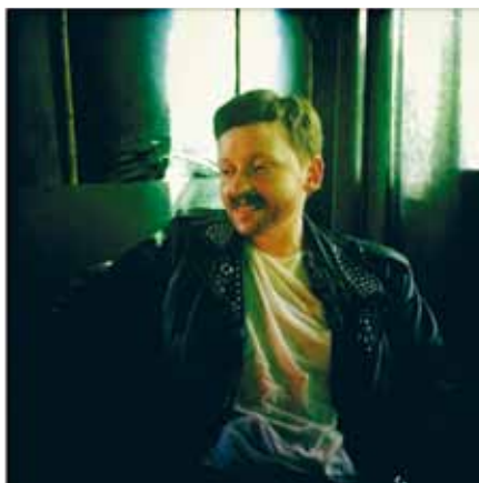
Les Trois Petits Cochons, 2012