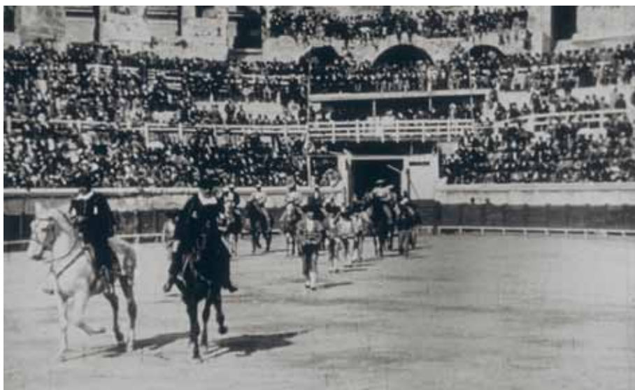
Sortie de la Quadrille [Cat. Lumière N°863] Opérateur inconnu, Nîmes, 8 mai 1898 © Association frères Lumière

Samedi 27 avril, 17h30, Petite salle, entrée libre