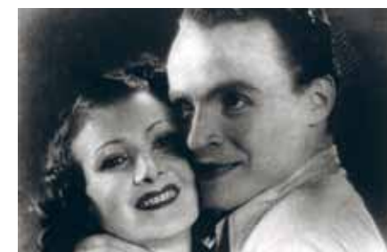
Innocence Unprotected, 1968