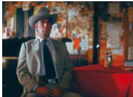
Electra Glide in Blue, 1973

Samedi 4 mai, 20h00, Cinéma 2, Séance présentée par Albert Serra et Abel Ferrara (cinéaste) [sous réserve]